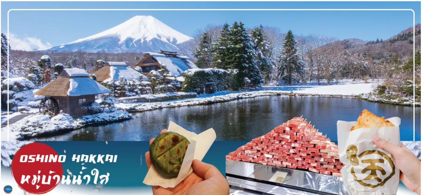
OSHINO HAKKAI หมู่บ้านน้ำใส

ให้ท่านเจาะลึกตามหาแหล่งบริสุทธิ์จากภูเขาไฟฟูจิ ที่เป็นแหล่งน้ำตามธรรมชาติตั้งอยู่ในหมู่บ้านโอชิโนะฮัคไค หรือพูดในทางกลับกันคือกลุ่มน้ำผุดโอชิโนะฮัคไค เพียงก้าวแรกที่ย่างเท้าเข้าไปในหมู่บ้านก็สัมผัสได้ถึงอากาศบริสุทธิ์ และไอเย็นจากแหล่งน้ำธรรมชาติที่มีให้เห็นอยู่ทุกมุม โดยในบ่อน้ำใสแจ๋วมีปลาหลากหลายพันธุ์แหวกว่ายอย่างสบายอารมณ์ แต่ขอบอกเลยว่าน้ำแต่ละบ่อนั้นเย็นจับใจจนแอบสงสัยว่าน้องปลาไม่หนาวสะท้านกันบ้างหรือ