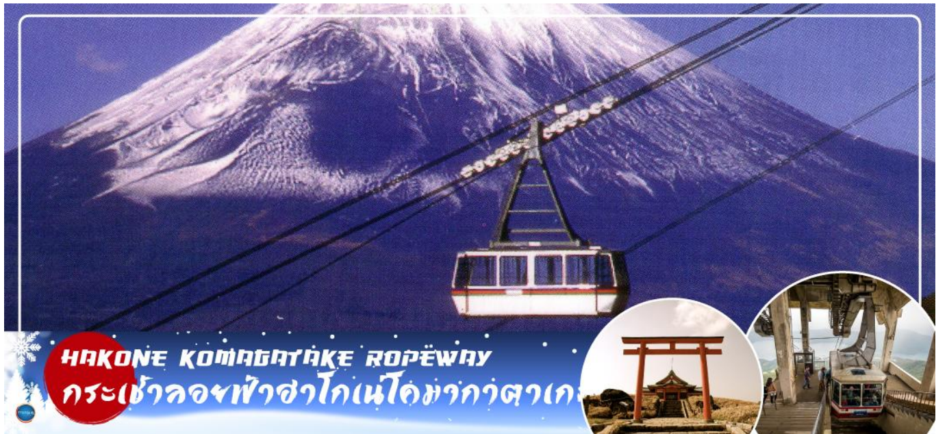
HAKONE KOMAGATAKE ROPEWAY กระเช้าลอยฟ้าฮาโกเนะโคมากะดาเกะ